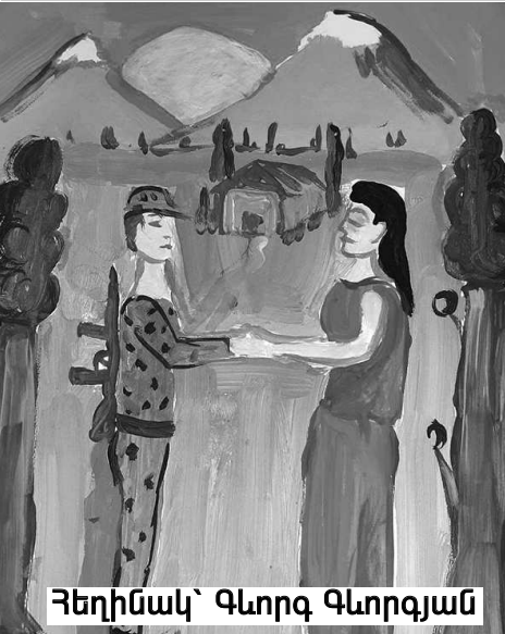
Հեղինակ` Գևորգ Գևորգյան

Մերձավոր Արևելքը, լինելով մեծ տերությունների բաժանարար գիծը, հազարավոր տարիներով երկարատև խաղաղություն չի պահպանել, այդ թվում նաև մեր հայրենիքը: Լինելով Արևելքի Արեւելքի կապող