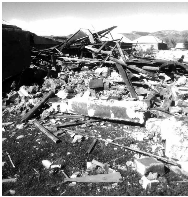
Հագարավոր մարդկանց կորուստ, խեղձած ճակատագրեր...

Նորից իմ բազմաշարժար հայրենիքում պայթեցին արկերը, զոհվեցին հարյուրավոր անմեղ մարդիկ, ովքեր ապրում, արարում են իրենց երկրում, արդար քրտինքով վաստակում հանապազօրյա հացը: